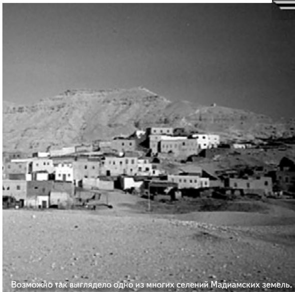
Возможно так выглядело одно из многих селений Мадиямских земель.

Положение Иофора, священника Мадиямского, показывает, что Истина сохранилась и даже процветала среди 'арабских' потомков Авраама, тогда как она полностью отсутствовала в Ханаане и опасными темпами шла на убыль в Египте.