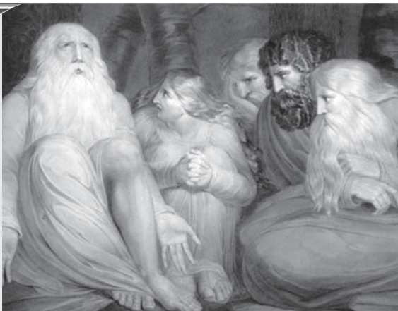
Страдание Иова, иллюстрация художника Уильяма Блэйка (William Blake),

“Был человек в земле Уц, имя его Иов; и был человек этот непорочен, справедлив и богобоязнен и удалялся от зла...” Так начинается эта древняя, величественная книга, ставшая предметом нашего каждодневного внимания под занавес уходящего 2004 года.