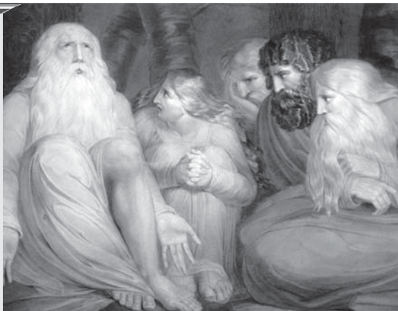
Страдание Иова, иллюстрация художника Уильяма Блэйка (William Blake),

“Был человек в земле Уц, имя его Иов; и был человек этот непорочен, справедлив и богобоязнен и удалялся от зла...” Так начинается эта древняя, величественная книга, ставшая предметом нашего каждодневного внимания под занавес уходящего 2004 года.